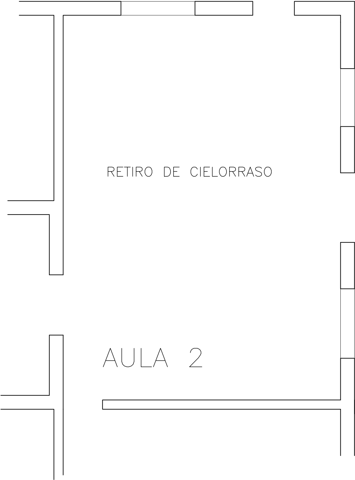
PLANTAS CON DESMANTELAMIENTOS ESCALA 1/50

NOTA: TODAS LAS MEDIDAS DE RECTIFICARAN EN OBRA